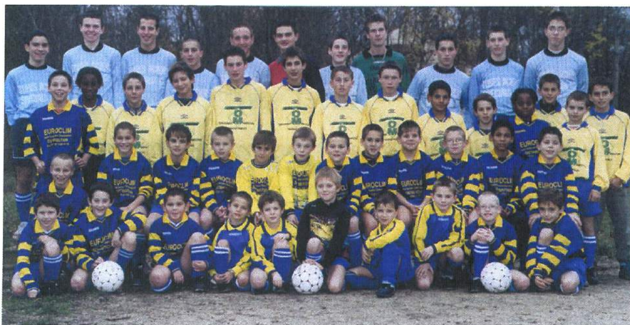
L'équipe de football pour la saison 2003 / 2004

Le président, les membres du bureau et tous les joueurs sont ravis de vous présenter leurs meilleurs vœux pour l'année 2004.