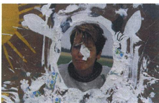
Différentes épreuves attractives