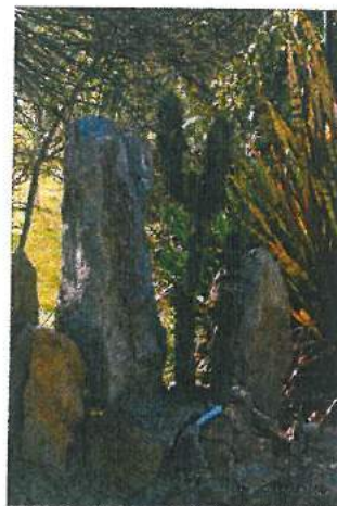
Un coin d'exotisme à Marnay

Cet atelier sera suivi de l'Assemblée Générale annuelle où sera renouvelé le Bureau et où seront proposées les prochaines activités.