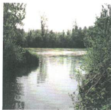
Embouchure de la Voulzie dans la Seine

Elle rejoint la Seine à Saint Sauveur les Bray.