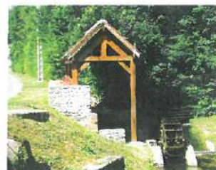
Le Lavoir et la Roue à aubes