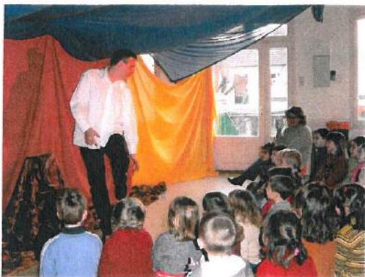
Le conteur est venu 3 fois animer des séances pour la Maternelle, les CP et les CE.

Le 09 mai, la Commission d'harmonisation a décidé le passage au collège de tous les élèves de CM2.