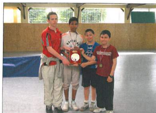
les espoirs de l'A.S.T.T.