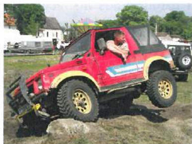
Photo 4 x 4

Nous avons constaté avec plaisir un nombre d'exposants sans cesse croissant par rapport aux années précédentes.