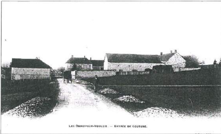
LA ROUTE DE COUTURE