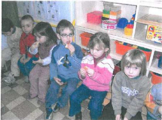
La classe maternelle a fêté la galette des rois le 13 janvier.