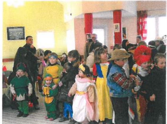
Le 18 mars a eu lieu le carnaval

Le 06 avril, les élèves de CM ont chanté pour leurs aînés de la Maison de Retraite, quelques chansons de Nino Ferrer, Charles Trenet, Félix Leclerc, Georges Brassens, Francis Lemarque et Mireille.