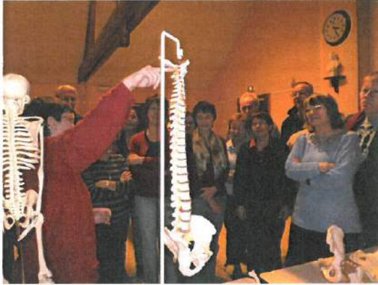
➤ Exposé-débat sur l'anatomie du mouvement