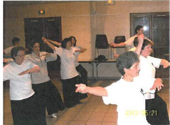
➤ Cours de Tai Chi Chuan

Notre association a débuté il y a bientôt 2 ans avec 9 adhérentes. Aujourd'hui, elle compte 21 pratiquants (dont 1 homme, il sera rejoint par un 2 e à la rentrée de septembre, avis aux amateurs !).