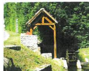
Le Lavoir et la Roue à aubes