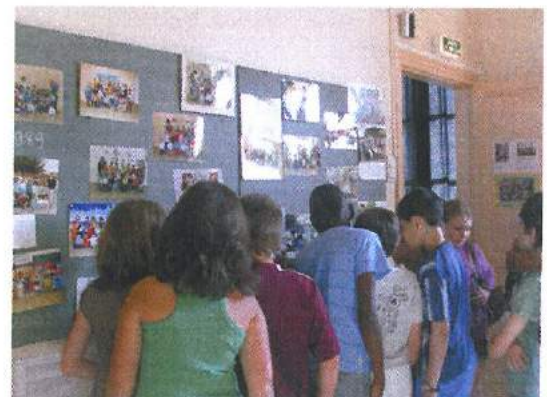
Ecole des Ormes

Beaucoup de personnes ont apprécié ce moment chaleureux.